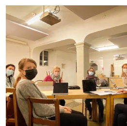
Impressionen aus dem Untervogthaus Sep. 20 - April 21